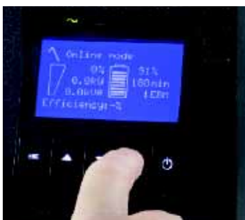
Ecran du 9SX incliné de 45° pour faciliter la lecture